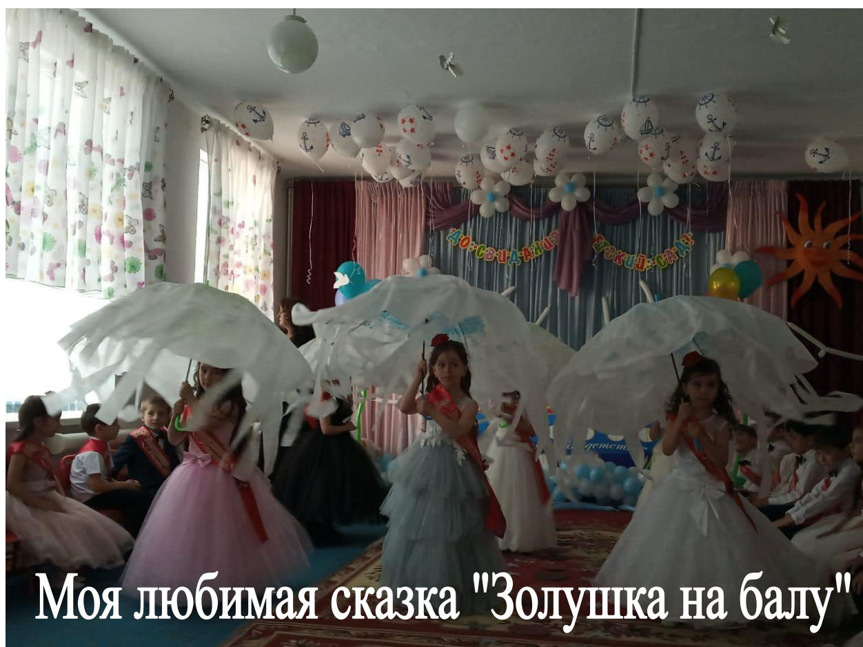
Моя любимая сказка "Золушка на балу"