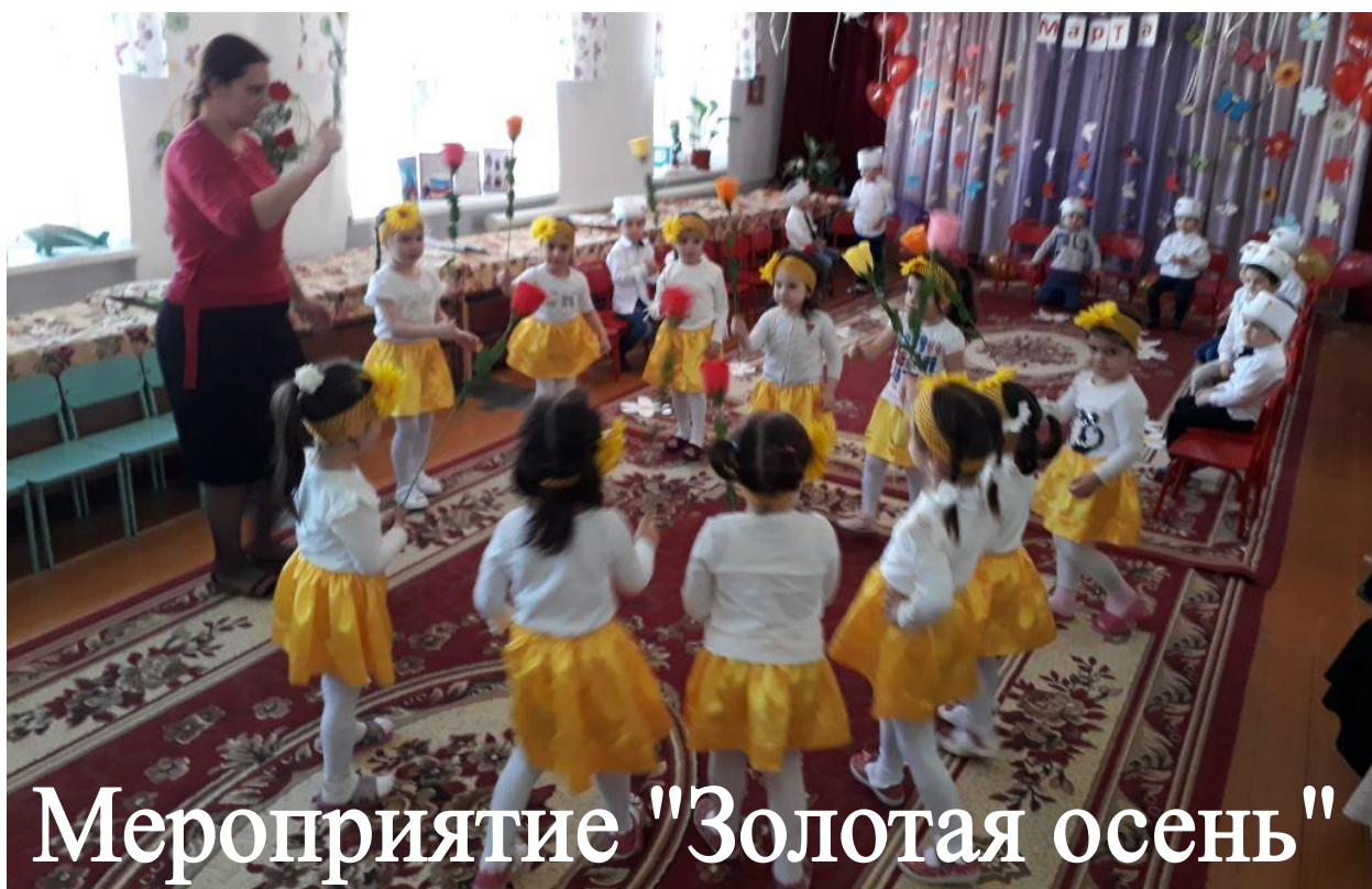
Мероприятие "Золотая осень"

В 2020-2021 учебном году планируется занятие ДОУ, совместное с родителями, участие в конкурсах различного уровня.