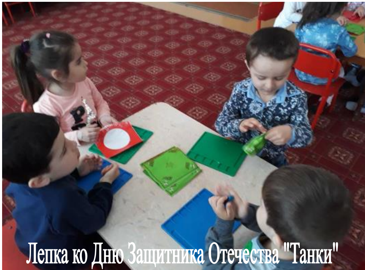
Лепка ко Дню Защитника Отечества "Танки"

Со стороны одарённого ребёнка – кроме способностей к анализу материала, сравнению, обобщению знаний и т.п., ребёнок должен обладать очень хорошей памятью, и что на наш взгляд является основополагающим залогом успеха – высокая мотивация к изучению выбранной предметной области и стремление совершенствовать свои знания и умения.