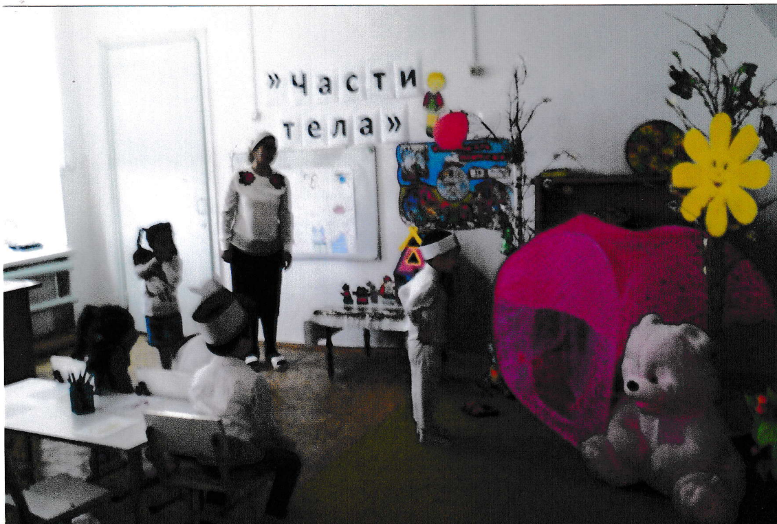
Инсценировка сказки «Теремок»