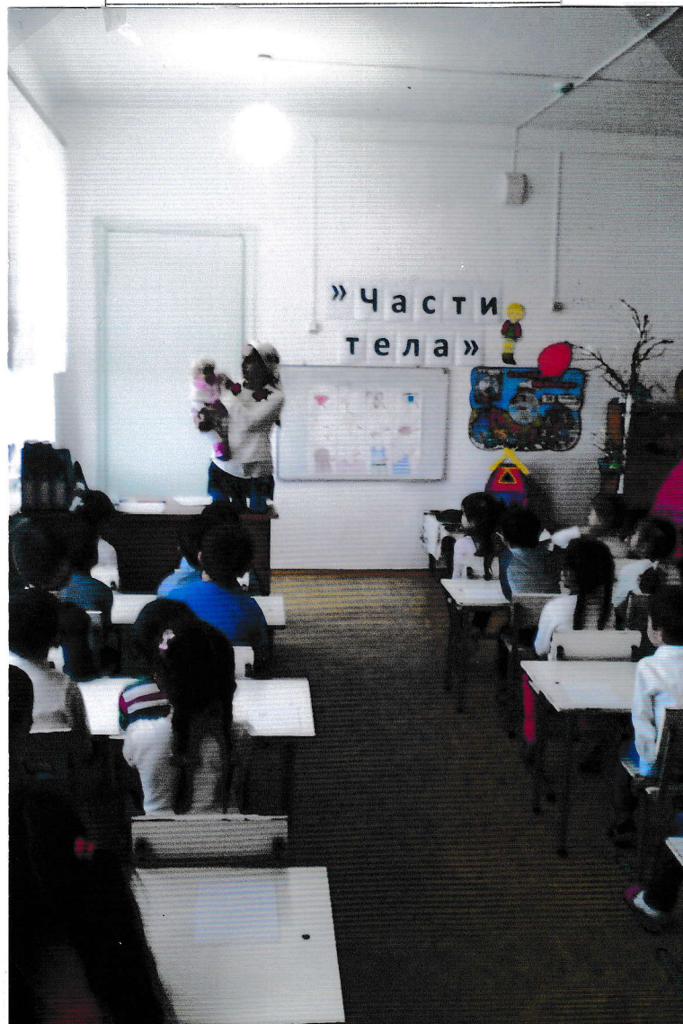
В гости пришла Кукла Глаша