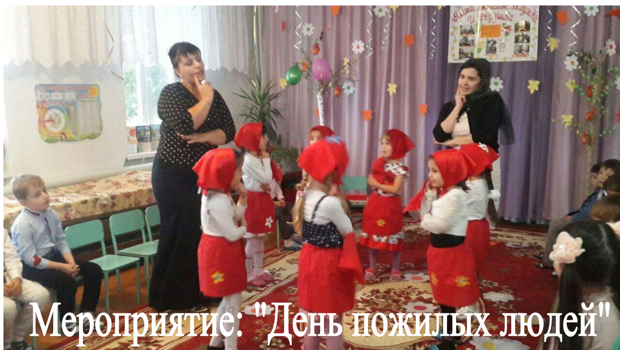
Мероприятие: "День пожилых людей"